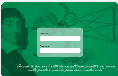
Portale Cartesio Consultazione ed esportazione dei Rapporti di Prova e Segnalazioni di dose.