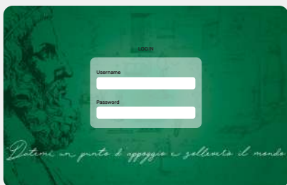
Portale Archimede Variazioni tracciate consultabili e telematiche.